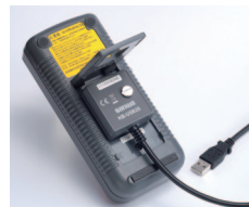
KB-USB20 PC 接続ケーブル (別売オプション) ◀取込み中の全体像